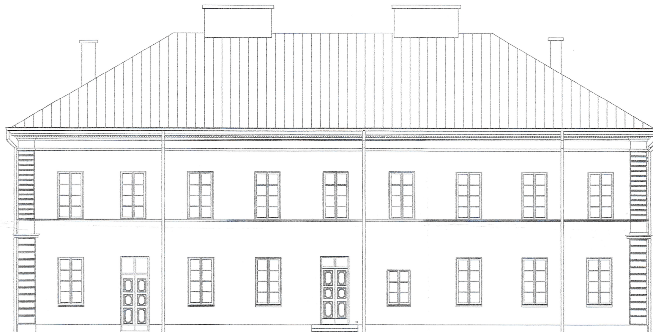
1 Południe 1 : 100