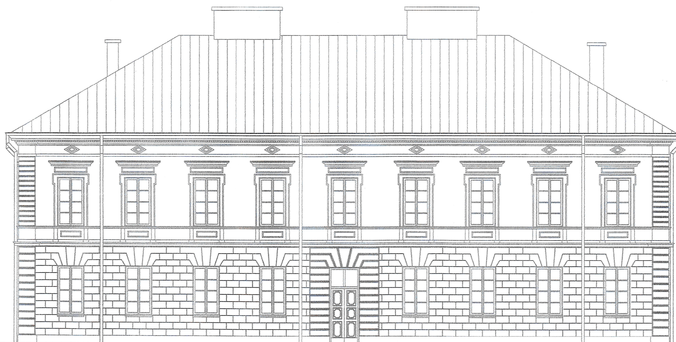
4 Północ 1 : 100